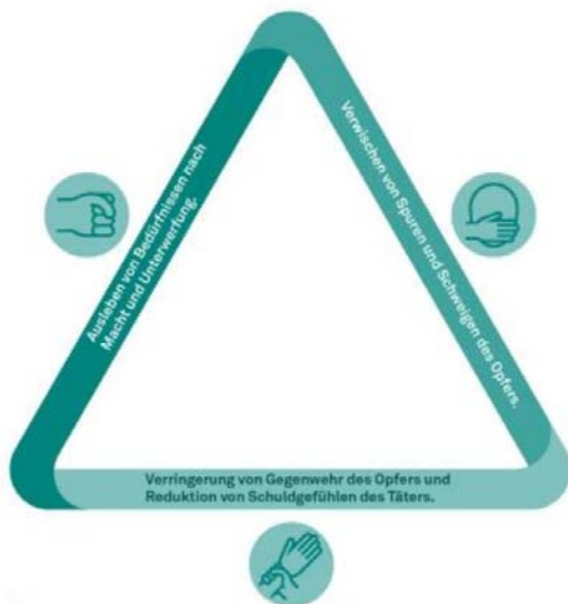
Abb.: Drei Hauptziele bei der Ausübung von (sexualisierter) Gewalt

Diese begrifflichen, holzschnittartigen Ausführungen sollen die nachfolgenden Ursachendarlegungen (s.a. Engfer, 2015: 19f.) für sexuellen Missbrauch bzw. sexualisierte Gewalt begleiten, wobei für ebensolche Situationen gilt: „Die Ursachen, die zu einer sexuellen Handlung eines Stiefvaters am Kind seiner Partnerin führen, unterscheiden sich von den Ursachen sexueller Gewalt, die von einer Gruppe Jugendlicher an einer Gleichaltrigen ausgeübt wird – ebenso unterscheiden sich die Folgen“ (Jud, 2015: 42; s.a. zu Folgen bei sexuellem Kindesmissbrauch u.a. Stompe 2017a).