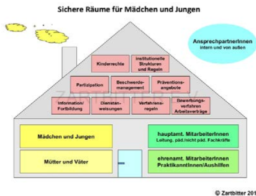
Abb.: Sichere Orte für Mädchen und Jungen 73

Abschließend – und egal ob für Einrichtungen des Selbstschutztrainings, Fußballvereine oder pädagogische Institutionen – gesagt, geht es um sichere Orte für Mädchen Jungen und in Enders (weiterführend: 2012: 319ff.) finden sich folgende Bausteine, so dass es nun zu bauen gilt: 72